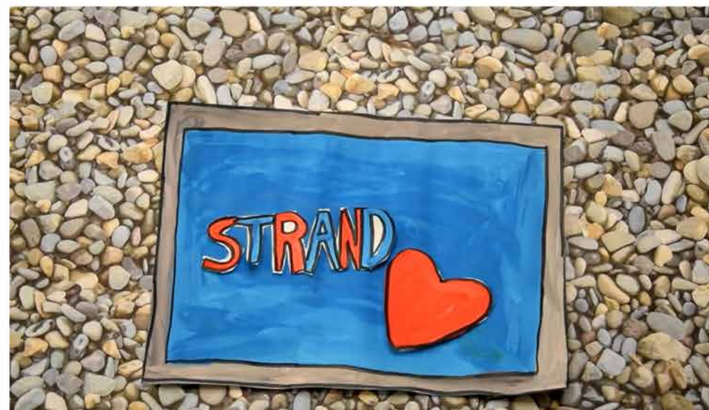
A Hurrá, strandolunk! című kisfilm megtekinthető a fürdő aulájában

Budapest 1. díj / Digitális alkotás kategória